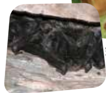
La barbastelle d'Europe