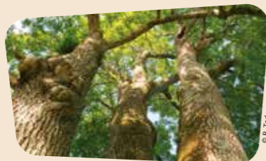
Frêne remarquable du pavillon de chasse