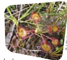
La drosera (petite plante carnivore protégée)